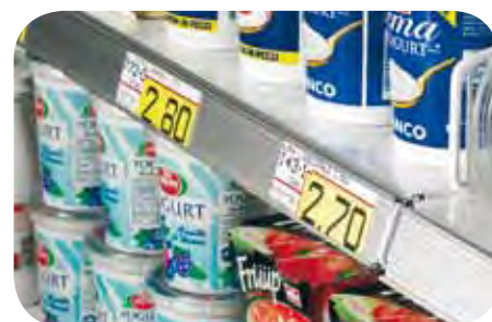
Portaprezzi in alluminio e plastica. Price holders in aluminum and plastic. Porte-prix en aluminium et en plastique. Alu- und Kunststoff- Preisschienen. Porta precios de aluminio y plástico. Держатели ценников из алюминия и пластмассы.