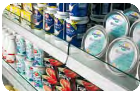
Spondine in cristallo. Crystal risers. Balconnets en verre. Kristallglasfrontscheiben. Bordes de cristal. Стекланные бортики.