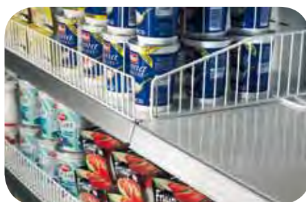
Spondine e divisori in filo. Wire risers and partitions. Balconnets et séparateurs en fil. Frontscheibe und Gittertrennwände. Bordes y tabiques de alambre. Бортики и делители из проволоки.