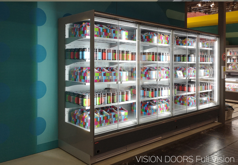
VISION DOORS Full Vision

VISION , verticali multipiano e multiprodotto. Dotati di porte a vetro, anche full vision, danno massimo risalto e appeal emozionale ai prodotti esposti e contengono sempre più le dispersioni termiche, nel segno della salvaguardia dell'ambiente e del risparmio energetico.