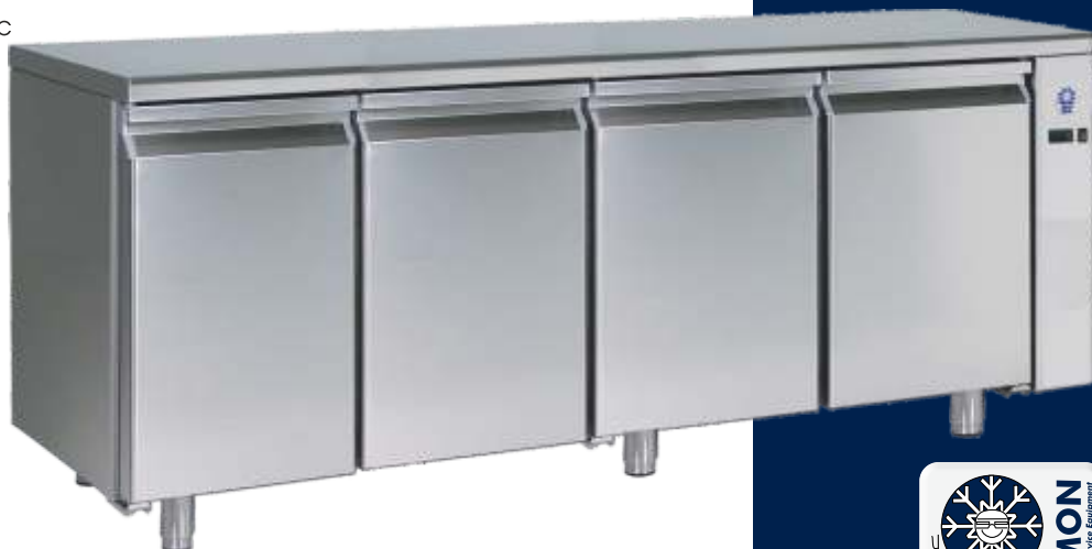
Table profondeur 70cm Préparée pour moteur a distance avec soupape thermostatique Contrôle électronique Ventilé Cycle de degivrage automatique Révêtement exteireur/intérieur en acier inoxydable AISI 304 N. 1 grille dim. 530x325 mm dans chaque cuve Isolament sans CFC de 60 mm Pieds réglables en inox Température ambiante + 43 ° C Gas : R404a Pour TGM2R - TGB2R 2 portillons Pour TGM3R - TGB3R 3 portillons Pour TGM4R - TGB4R 4 portillons