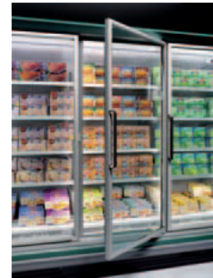
version aluminium doors