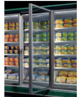
version silk-screened doors