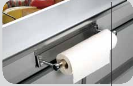
Portarotolo. Paper towel holder. Porte-rouleau. Papierrollenträger. Porta-rollo. Держатель рулона бумаги.