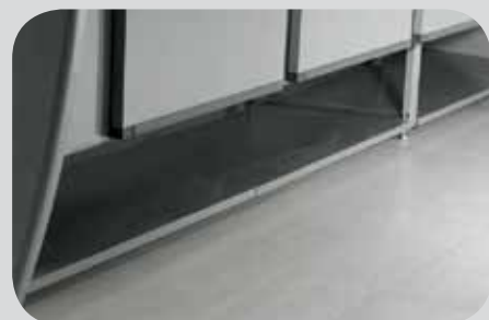
Vano posteriore a giorno. Open rear compartment. Réserve arrière ouverte. Offenes Vorratsfach im Möbelunterbau. Local posterior abierto. Заднее отделение открытое.