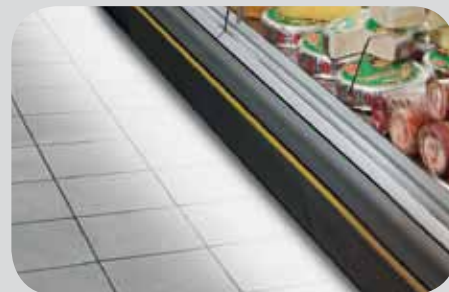
Illuminazione fronte esterno. Front lighting. Eclairage extérieur du front. Frontbeleuchtung. Iluminación frontal al exterior. Наружное фронтальное освещение.