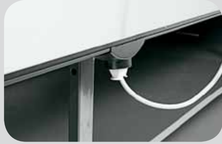
Kit presa elettrica. Socket-holder kit. Kit prise électrique. Bausatz Netzsteckdose. Kit Tomacorriente. Набор элнетрических розеток.