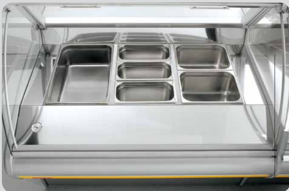
Vaschette gastro-norm. Gastro-norm trays. Bacs Gastronorm. Gastronorm Schalen. Cubetas Gastronorm. Лотки гастро-норм.