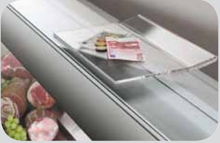
Rendiresto plexiglas. Plexiglass change dish. Plateau rend monnaie en plexiglas. Rückgeldbehälter aus Plexiglas. Bandeja-portamonedas en plexiglás. Подставка для сдачи из плексигласа.