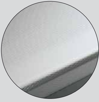
Piano lavoro inox. Stainless steel counter. Tablette de travail inox. Arbeitsplatte aus Edelstahl. Plano de trabajo inox. Рабочая поверхность из нерж. стали inox.