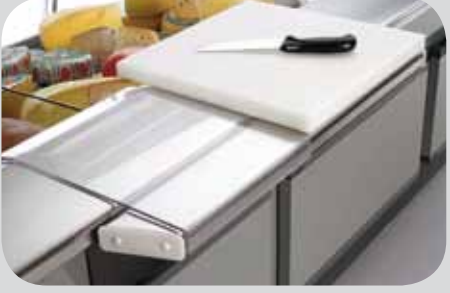
Estensione piano lavoro - Asse tagliere - Piano per incarto in plexiglas. Working shelf extension - Cutting board - Wrapping table. Extension tablette de travail - Planche à couper - Tablette pour emballage en plexiglas. Verlängerung der Arbeitsplatte - Schneidebrett - Verpackungsfläche aus Plexiglas. Extensión plano de trabajo - Tabla de corte - Superficie para envolver en plexiglás. Удлинитель рабочего стола - Доска длл резки - Стол из плексигласа длл упаковки.