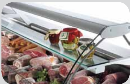
Piano intermedio - Illuminazione piano intermedio. Intermediate shelf - Illumination of intermediate shelf. Étagère intermédiaire - Éclairage étagère intermédiaire. Zwischenauslage - Beleuchtung der Zwischenauslage. Plano intermedio - Iluminación plano intermedio. Промежуточная полка. - Освещение промежуточной полки.