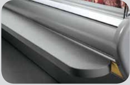
Poggiaborse. Bag rests. Repose-sacs. Taschenablage. Ароуа-bolsas. Подставка для сумок.