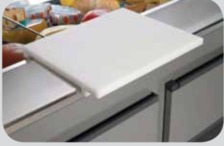
Asse tagliere. Cutting board. Planche à couper. Schneidebrett. Tabla de corte. Доска для резки.