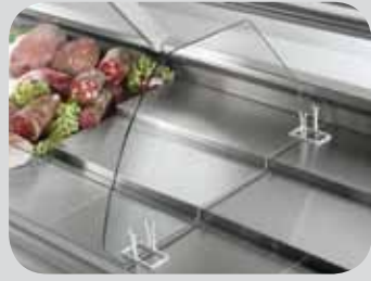
Divisori bassi e alti per ripiano STD o a uno e due gradini. High and low partitions for STD shelf or one and two steps. Séparations basses et hautes pour étagère STD à un et à deux marches. Hohe und niedrige Trennwände für ein- und zweistufige STD-Auslagen. Divisores bajos y altos para estante STD o con uno y dos niveles. Низкие и высокие делители для полки STD или одно- и двухступенчатые.