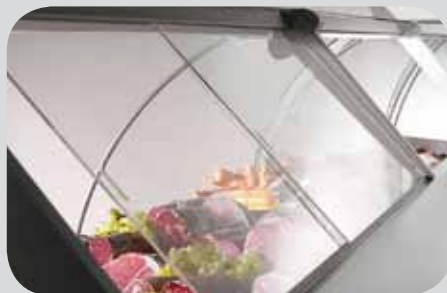
Scorrevoli posteriori. Sliding rear doors. Couissantes postérieures. Schiebescheiben. Corredizos posteriores. Задние раздвижные дверцы.