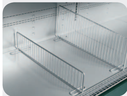
Divisori vasca. Basin dividers. Boden-Trenngitter. Séparation cuve. Divisorios cuba. Разделитель ванны.