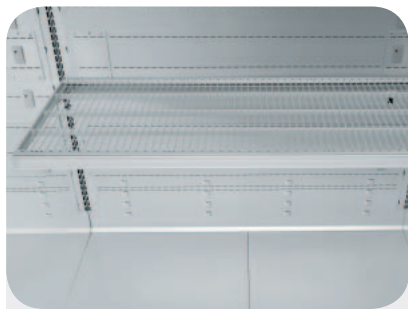
Ripiani in filo. Wire shelves. Gitter Etagen. Etagères grille. Repisas en rejilla. Полка проволочная.