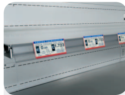
Portaprezzi trasparente ripiano IMZ. Transparent price-holder IMZ shelf. Dursichtbare Preisschiene - IMZ Etagé Porte-prix transparent étagère IMZ. Portaprecios transparentes para repisa IMZ. Ценникодержатель прозрачный для полки IMZ.