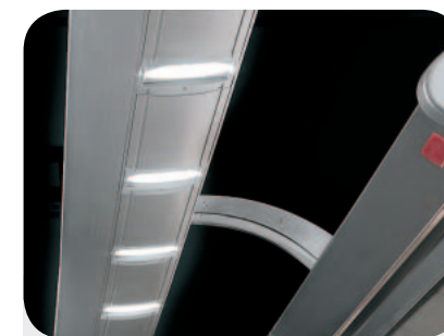
Illuminazione superiore esterna. Lighting arm. Obere äussere Beleuchtung. Eclairage supérieur extérieur. Iluminación superior externa. Верхняя внешняя подсветка.