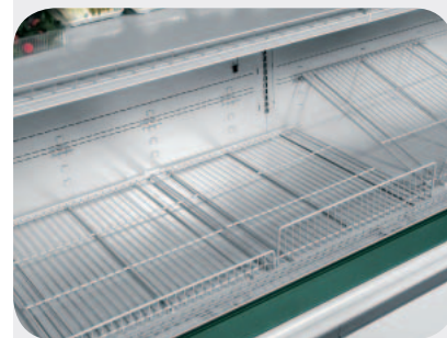
Griglie di fondo. Base grids. Bodengitter. Grilles de fond. Rejilla de fondo. Базовые решетки.