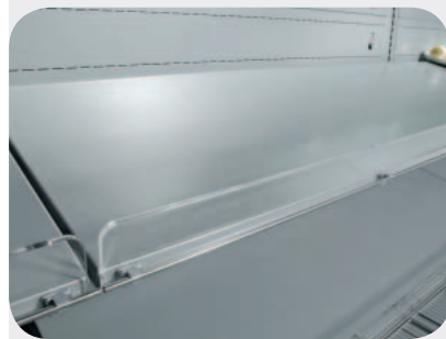
Spondina in plexi. Plexi front riser. Frontstopper aus Plexi. Balconnet plexi. Barandilla estante en plexi. Ограничитель из плексигласа.