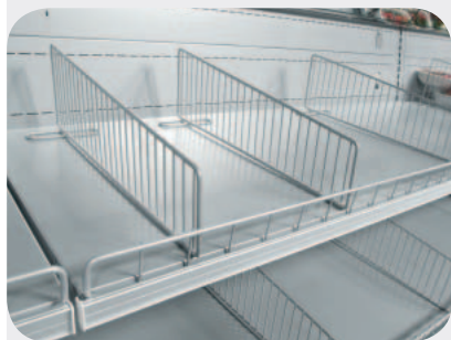
Divisori ripiani in filo. Grid shelf dividers. Trenngitter für Etagen. Séparation étagère grille. Divisorio recisa en plexi. Разделитель полки проволочный.