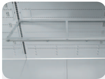
Ripiani in plexi. Plexi shelves. Plexi Etagen. Etagères plexi. Repisas en plexi. Полка из плексигласа.