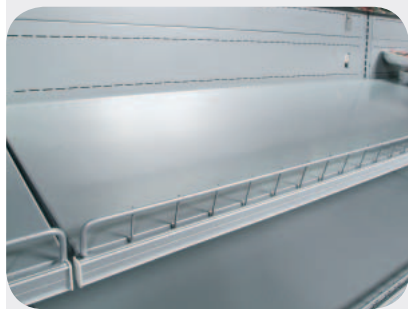
Spondina in filo. Grid front riser. Frontgitter. Balconnet grille. Barandilla estante en rejilla. Ограничитель проволочный.