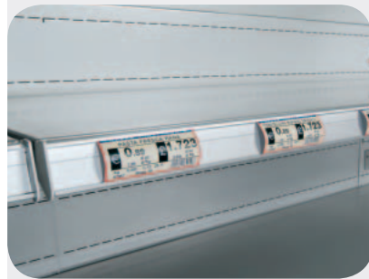
Portaprezzi H32 ripiano IMZ. Transparent price-holder H32 IMZ shelf. Preisschiene H32 - IMZ Etagé. Porte-prix H32 étagère IMZ. Portaprecios H32 para repisa IMZ. Ценникодержатель H32 для полки IMZ.