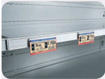
Portaprezzi H25 ripiano IMZ. Transparent price-holder H25 IMZ shelf. Preisschiene H25 - IMZ Etagé. Porte-prix H25 étagère IMZ. Portaprecios H25 para repisa IMZ. Ценникодержатель H25 для полки IMZ.