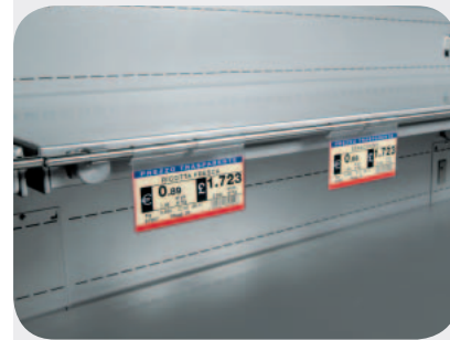
Portaprezzi a bacchetta ripiano IMZ. Rod price-holder. Rundeisen Preisschiene - IMZ Etagé. Porte-prix à barre étagère IMZ. Portaprecios a varilla repisa IMZ. Ценникодержатель флажковый для полки IMZ.