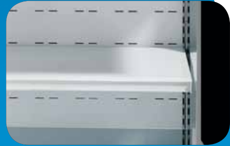
Ripiano aggiuntivo - Illuminazione ripiani. Extra shelf - Shelf illumination. Tablette supplémentaire - Éclairage étagères. Zusätzliche Etage - Auslagenbeleuchtung. Estante adicional - Iluminación estantes. Дополнительная полка - Освещение полок.