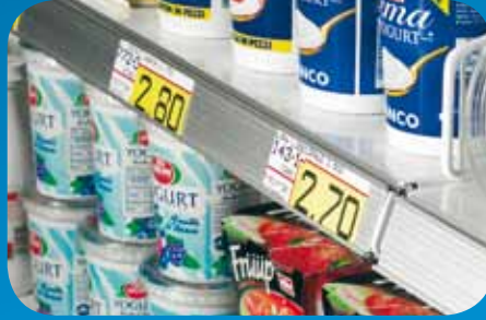
Portaprezzi in alluminio e plastica. Price holders in aluminum and plastic. Porte-prix en aluminium et en plastique. Alu- und Kunststoff- Preisschienen. Porta precios de aluminio y plástico. Держатели ценников из алюминия и пластмассы.