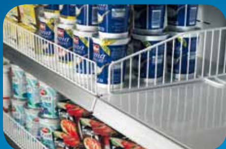
Spondine e divisori in filo. Wire risers and partitions. Balconnets et séparateurs en fil. Frontscheibe und Gittertrennwände. Bordes y tabiques de alambre. Бортики и делители из проволоки.

Пристенная горка «Argus Doors» с положительной температурой, благодаря своей небольшой высоте гарантирует обширный объем экспозиционной площади и отличную видимость выложенных продуктов. Холодильное оборудование с дверцами из стеклопакетов представляет собой ответ на новое растущее требование рынка, касающееся торгового оборудования, обеспечивающего существенное сокращение потребления энергии, в сочетании с улучшением эксплуатационных показателей хранения выложенных продуктов. Наличие стеклянных дверец способствует также улучшению комфорта покупателей, достигнутого благодаря сокращению ощущения холода при прохождении вдоль торгового ряда. Кроме того возможность «компоновки в линию» с другими моделями горок «Argus» усиливает гибкость ее использования и позволяет дифференцировать экспозиционную типологию.