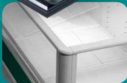
Griglie di fondo. Base grids. Bodengitter. Grilles de fond. Rejilla de fondo. Базовые решетки.