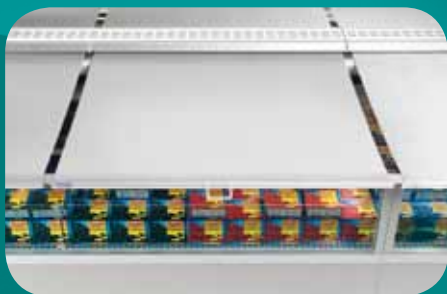
Tenda notte. Nightblind. Nachtrollo. Rideau de nuit. Cortina de noche. Ночные шторы.