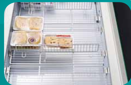
Divisori vasca. Basin dividers. Boden-Trenngitter. Séparation cuve. Divisórios cuba. Разделитель ванны.